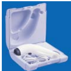
БИОПТРОН Компакт III