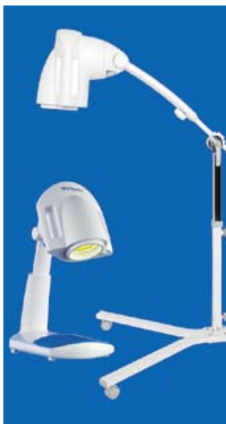
БИОПТРОН ПРО 1